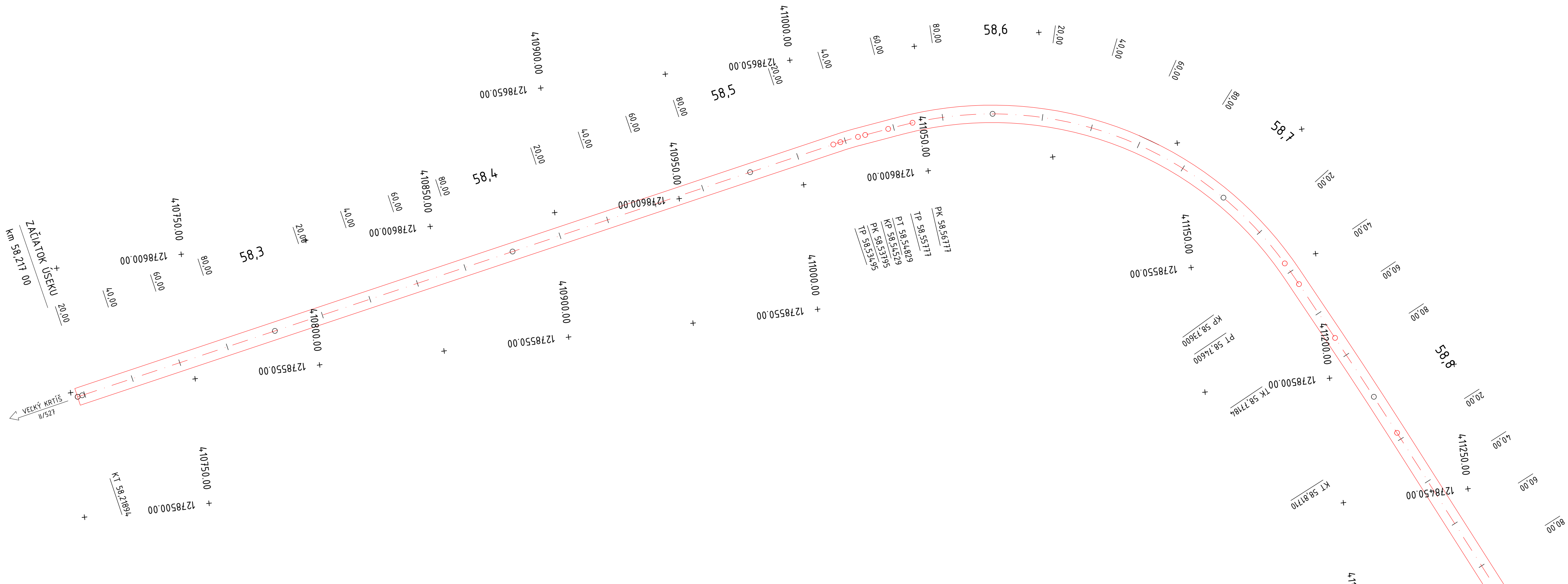
ÚDAJE O PODROBNÝCH BODOCH TRASY